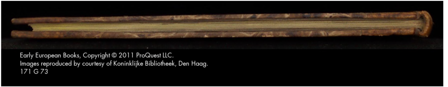
Early European Books, Copyright © 2011 ProQuest LLC. Images reproduced by courtesy of Koninklijke Bibliotheek, Den Haag. 171 G 73